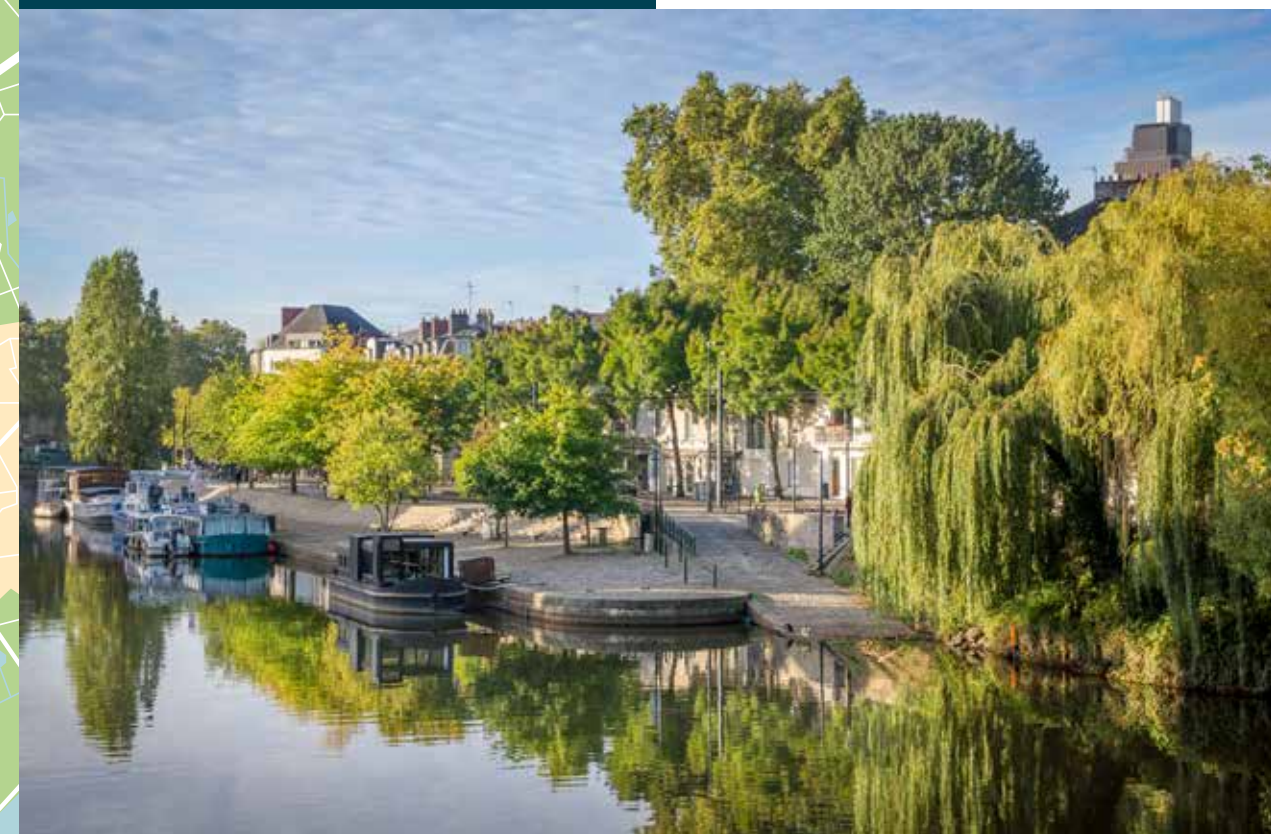
Bords de l'Erdre

Jeune et dynamique , ce quartier est le parfait équilibre entre nature, culture et entreprise. Abritant le campus universitaire ainsi que des grandes écoles , il séduit également les entreprises issues de la filière des technologies d'information et de communication situées au cœur du parc d'innovation , le Hub Créatic . Ce site regroupe enfin de nombreux parcs verdoyants ainsi que le parc des expositions et le célèbre stade de la Beaujoire, permettant aux habitants de profiter d'une promenade, d'un cadre bucolique , et de participer à de divers rendez-vous culturels et sportifs.