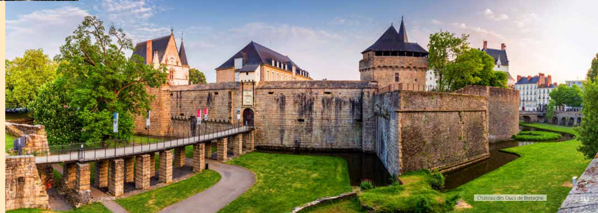
Château des Ducs de Bretagne