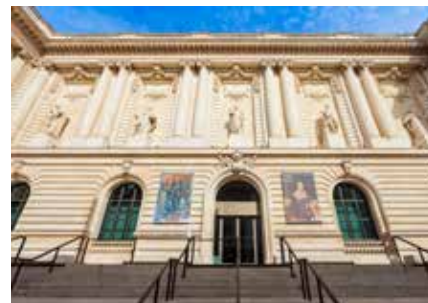
Musée d'Arts de Nantes