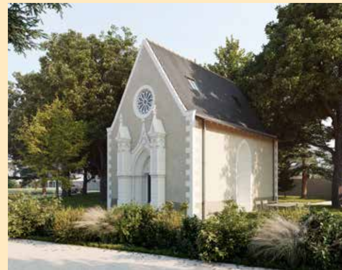
Vue de la Chapelle