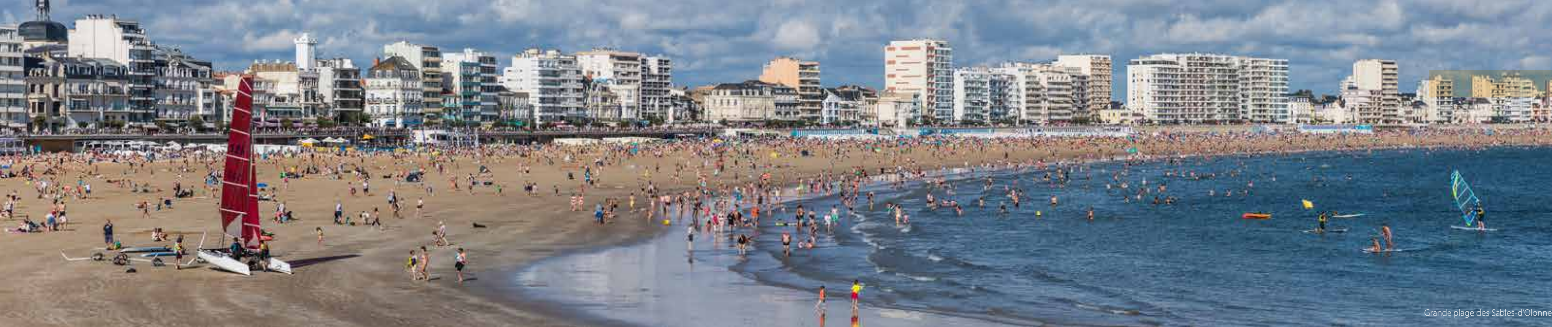
Grande plage des Sables-d'Olonne