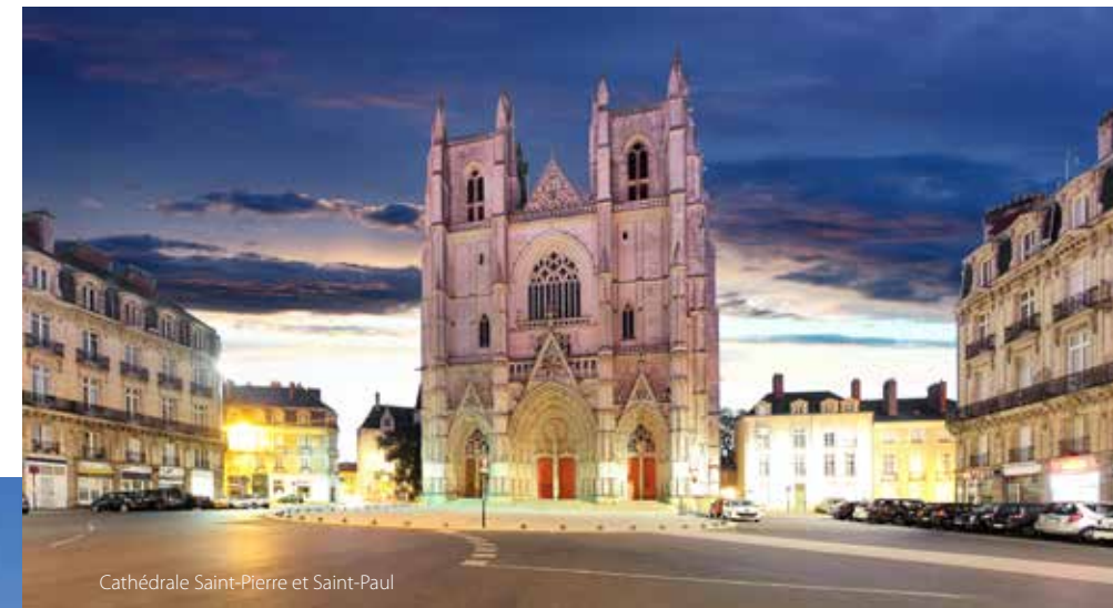
Cathédrale Saint-Pierre et Saint-Paul