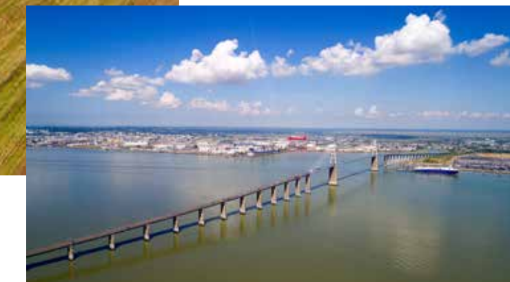
Pont de Saint-Nazaire