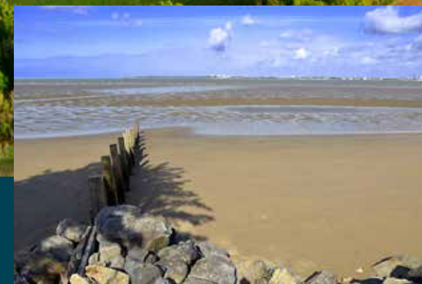
Plage de Saint-Brevin-les-Pins