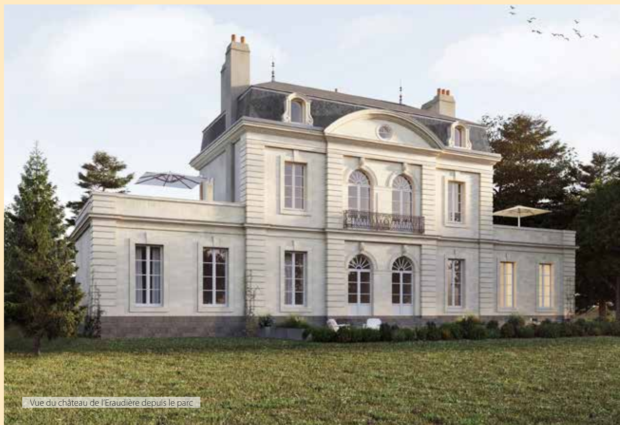
Vue du château de l'Eraudière depuis le parc