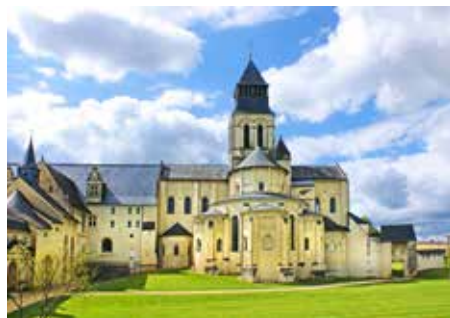
Abbaye de Fontevraud